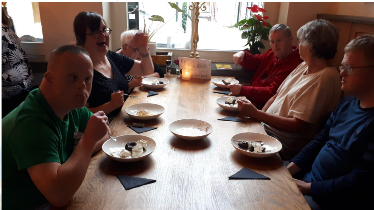
En het heeft lekker gesmaakt.