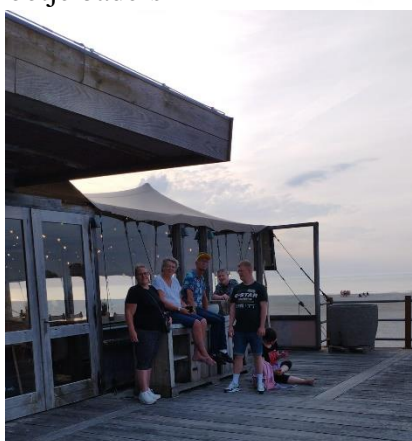
Kijkers op afstand enne