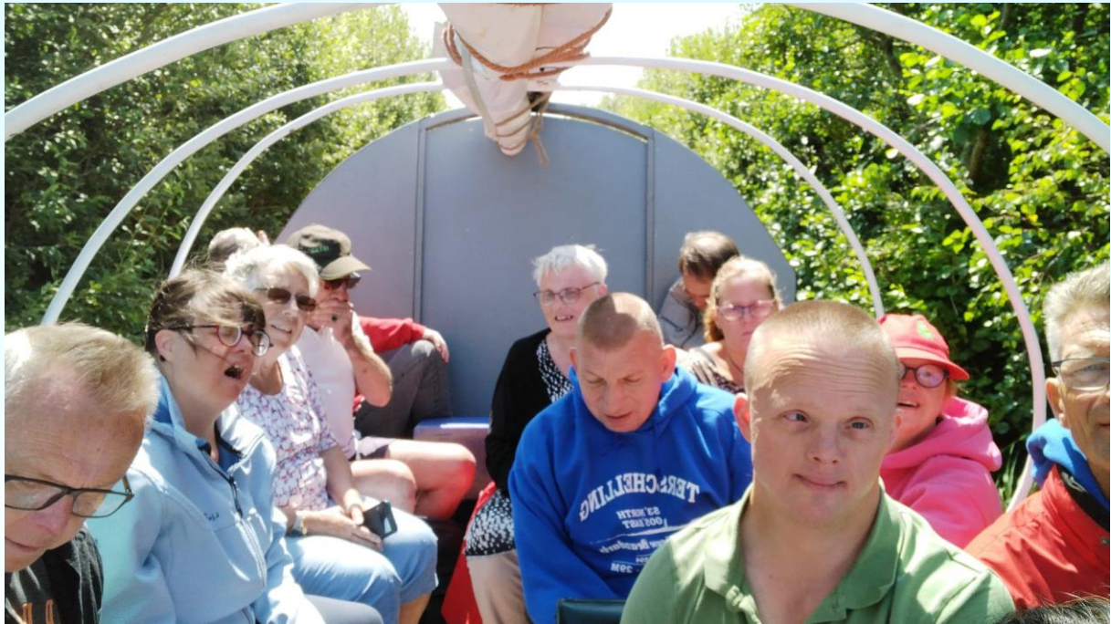
Iedereen uitstappen, want voor de paarden is de volle bak te zwaar.