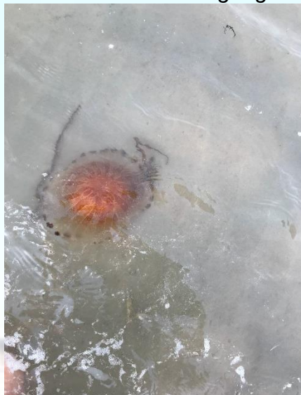
mooie kwallen in zee